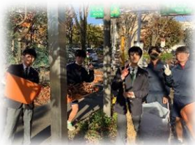
志木二中で集めた落ち葉